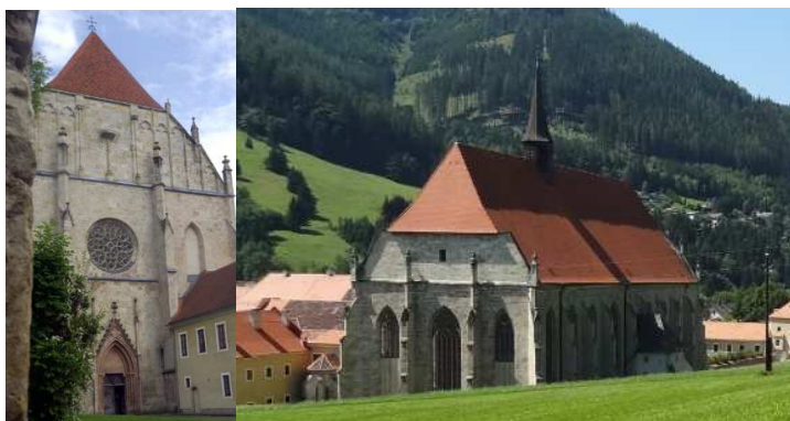
Münster Neuberg an der Mürz

Die Zisterzienser Hallenkirche aus dem 14. JHDT ist der Krönung und Himmelfahrt Mariens geweiht. Besonders sehenswert ist der Kreuzgang, der Renaissance Hochaltar und der Kapitelsaal mit der Stiftergruft von Herzog Otto des Fröhlichen und seiner Familie.