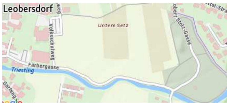
Parkplatz beim Eventcenter

Ruhezonen, Motorikgeräte und es gibt die Möglichkeit im Fluss zu planschen. Getränke und Jause mitnehmen. Nicht weit entfernt gibt es am Hauptplatz von Leobersdorf zwei Eissalons.